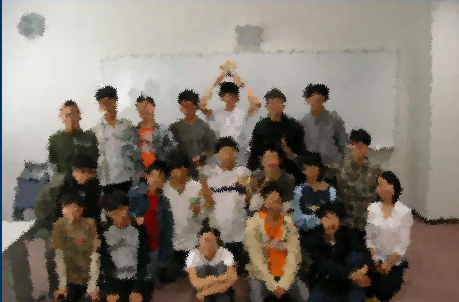
「サイエンス研究会」