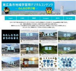
「のん太の学び場」トップページ