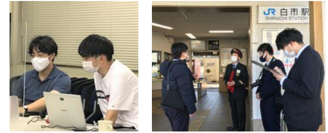
広島大学教育ビジョン研究センター(EVRI)の教員・研究員と学生が共同で開発しました

「のん太の学び場」は、社会科副読本『わたしたちの東広島市』を参考に設定されたキーワードを深く学ぶデジタルコンテンツです。 ▶ 東広島市の「魅力」と「課題」を考える30のキーワードを取り上げます。単なる「読み物」ではありません。「学習支援」のコンテンツです。 令和3年3月の段階で、累計30のコンテンツが完成しました。