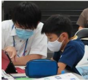
東広島市立中央図書館で行った公開講座の様子

「のん太の学び場」は、子どもの自由研究や市民の生涯学習の場として利用できます。 ▶ 広島大学教育ビジョン研究センターは、学生の協力を得て、出前授業や公開講座等を提供してまいります。学習のてびきも開発しました。