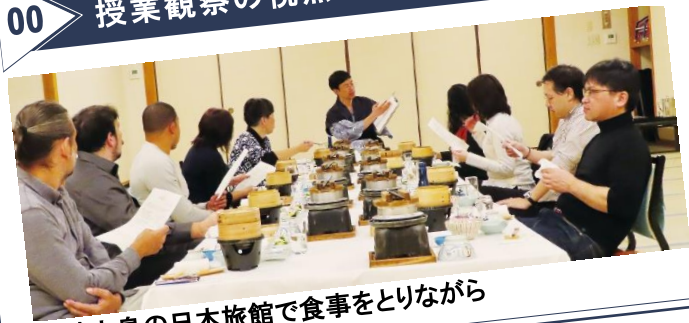
大崎上島の日本旅館で食事をとりながら