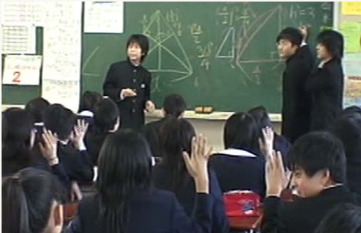
図.グループによる発表の場面